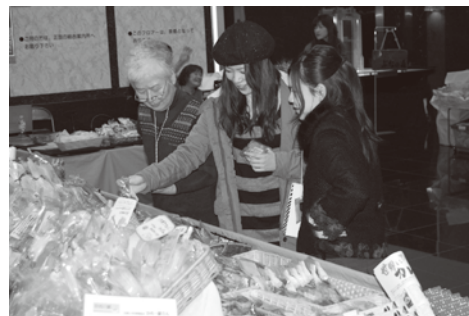
ふれあいトゥギャザー風景

1人でも多くの方々に見ていただき買っていただくのが私たちの願いですが、きびしい経済環境の中、前年の実績を上回ることができました。