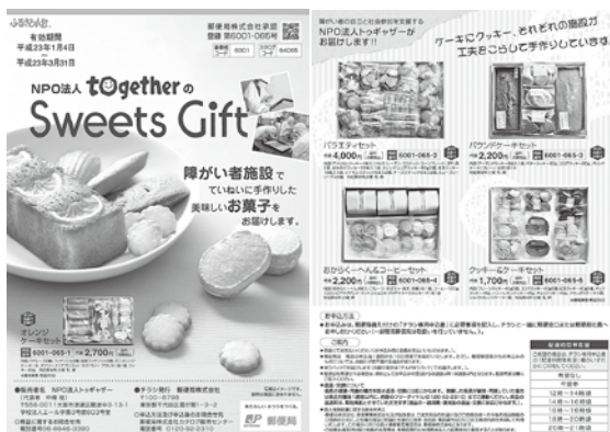
郵便局で配布中のチラシ

全国的に見ても初めての試みで施設製品の販売に新しい活路を拓くものとして、話題性も有り各界より注目されています。