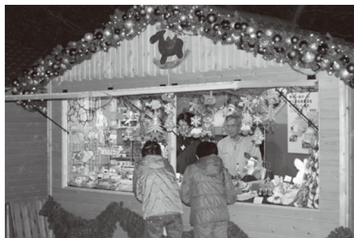
OBPクリスマスマーケット風景

商品の仕入れや管理・レイアウトと障害者施設の商品を中心に担当し貴重な体験をしました。