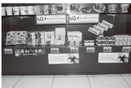
エムズホール景品コーナー風景

大分県大分市のパチンコ店「エムズホール」の景品コーナーにトゥギャザーコーナーが完成しました。