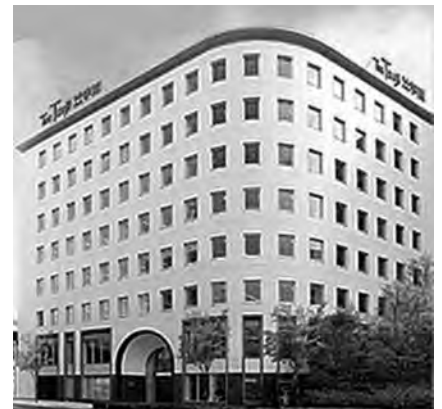
辻学園調理・製菓専門学校

この成果を12月の障害者週間に梅田スカイビル、そして来年には大手百貨店の特設会場で販売会を開催し皆様にご報告出来る予定です。広い場に出て、1人でも多くの方に食べていただくことで施設のお菓子の販路の拡大につながればと思っています。