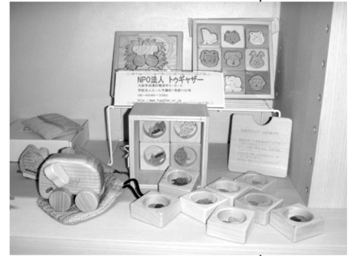
(ギャラリー内の展示)

心齋橋商店街の中ということもあり、人通りも多く売れ行きも好調でしたが、私たちの活動のPRにも役立ちました。トゥギャザーでは、これらの木工製品を新しい事業の柱として育てていきたいと考えています。