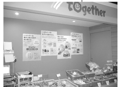
(三井住友海上淀屋橋ビル内にある「とっと」)

「とっと」とはNPO法人トゥギャザーが運営する障害者施設で作られたお菓子を販売するお店です。