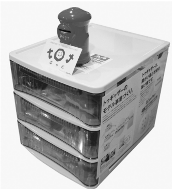
(とっとの置き菓子)

まだまだ始めたばかりですが「オフィスで出来るおいしい社会貢献」として好評でこれからは楽しみです。