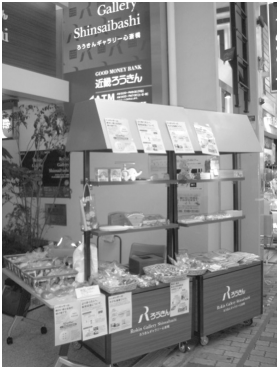
(ワゴンによる販売会)

トゥギャザーは各地で作られている、木工の知育玩具を中心に構成しましたが大変好評です。