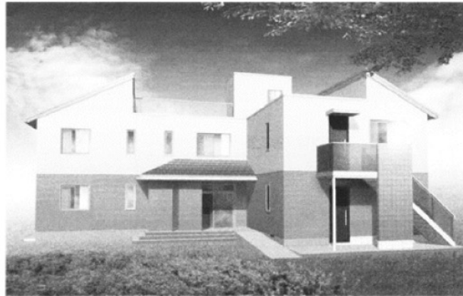
生活支援センター「あゆ」

とんぼ福祉会（茨木市）のみなさんの長い年月の夢であった生活支援センター「あゆ」がこのほどでき上がり、去る8月2日現地で盛大に竣工式、お披露目が行われました。