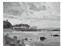
荒崎の夕日(三浦半島)