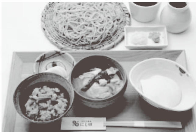
数量限定のランチ Aセット 税込1630円～

こだわり食材の使った数量限定のランチセットは、選べるお蕎麦・おぼろ豆腐・一品料理・炊き込みご飯orとろろご飯の4つを楽しむことができる大変お得なセットです。一品料理は、数種類の中から1つ選ぶことができます。(時期により料理、選択数は異なります。)