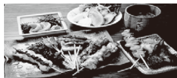
やきとり/高千穂コース2,500円