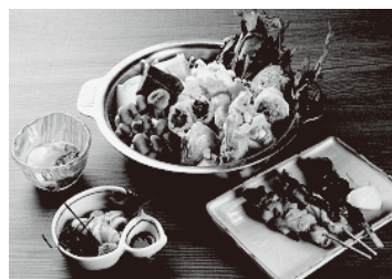
水炊き/コース3,800円 単品2,800円

水だきと鳥料理の専門店として、昭和4年に大阪千日前に開店して以来、3代にわたって味と料理へのこだわりを伝えてまいりました。新三浦の代名詞ともいえる白濁したスープは、鶏ガラだけを使い8時間以上かけて、じっくり旨味を引き出したものです。このスープの味とこだわりは、代々の店主が変わることなく守り続けてきたものです。現当主は、伝統の味と「美味しいものを食べて喜んでいただきたい」という料理や酒の品揃えを受け継ぎながら、和のメニューだけにこだわらず普段食べ慣れた鳥を一工夫して「今まで食べた事がない！」と感動していただける料理を心掛けています。